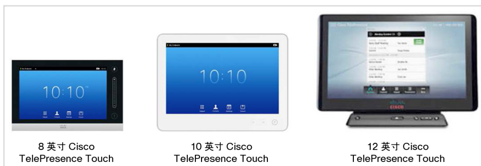
图 1. Cisco TelePresence Touch

Cisco TelePresence Touch 设备配备革命性的用户界面，重在支持以人为本的一对一和群组优质通信。如今的工作环境需要跨通信媒介进行交互，并且需要随不同环境、联系人和内容进行变化。使用 Cisco TelePresence Touch 设备，您可以在交互环境中快速轻松地访问最常见的任务。通过创新的设计，可以轻松与多种形式的同步和异步通信进行集成，这已成为工作流程的一部分。