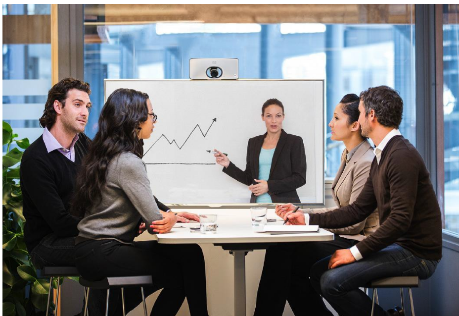
图 1. 项目会议室环境中的 Cisco TelePresence SX10

SX10 Quick Set 将高质量、简单性和经济性结合到一起，为普及视频打造了一种可行的解决方案（图 1 至图 3）。