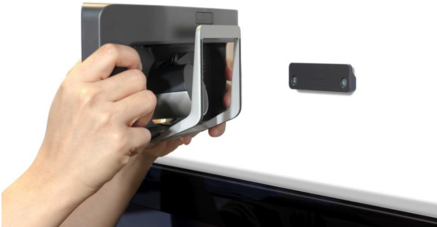
图 3. Cisco TelePresence SX10 壁装解决方案