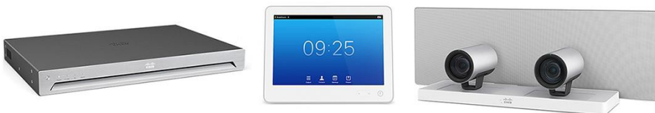
图 2. 配备有 Touch 10 和 SpeakerTrack 60 的 Cisco TelePresence SX80 集成包