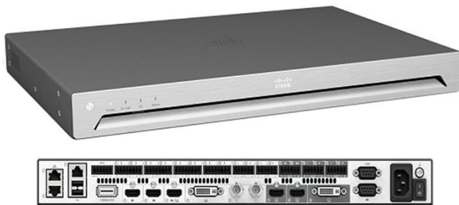
图 1. Cisco TelePresence SX80 编解码器

思科提供 3 种 SX80 集成包，以降低较大型会议室中装配视频对外部设备的要求和总体成本：