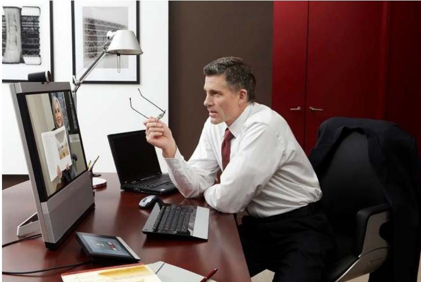
图 1. 通过思科桌面网真系统 EX90 实现个人网真